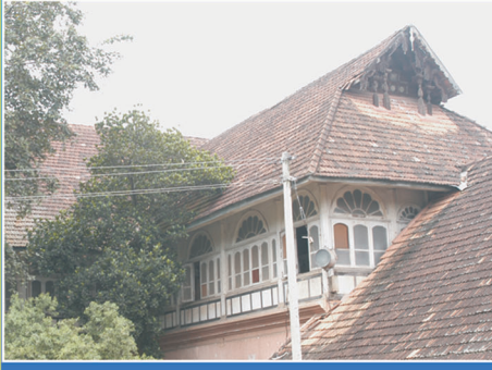
രംഗവിലാസം കൊട്ടാരം സംരക്ഷണത്തിനു മുൻപ്