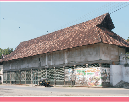
തെരക്കത്തൈരുമാളിക - സംരക്ഷണത്തിനു മുൻപ്