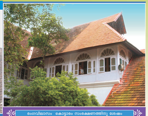
രംഗവിലാസം കൊട്ടാരം സംരക്ഷണത്തിനു ശേഷം