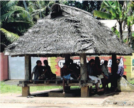
കലത്തട്ട് അതിലിവിട്ടു വെളളായണിയിലെ കളിത്തട്ട്

പരിശുദ്ധമായ പഴമയെക്കുറിച്ചാണ് മുന്നിലെ ഏറ്റവും വലിയ കളിത്തട്ട്. പഴയ പെരുമയെ നിലനിർത്തിക്കൊടുക്കാനും പുതിയ പെരുമയെ സൃഷ്ടിക്കാനും കളിത്തട്ട് സഹായകമാണ്. കളിത്തട്ട് പെരുമയെ നിലനിർത്തിക്കൊടുക്കാനും പുതിയ പെരുമയെ സൃഷ്ടിക്കാനും കളിത്തട്ട് സഹായകമാണ്. കളിത്തട്ട് പെരുമയെ നിലനിർത്തിക്കൊടുക്കാനും പുതിയ പെരുമയെ സൃഷ്ടിക്കാനും കളിത്തട്ട് സഹായകമാണ്.