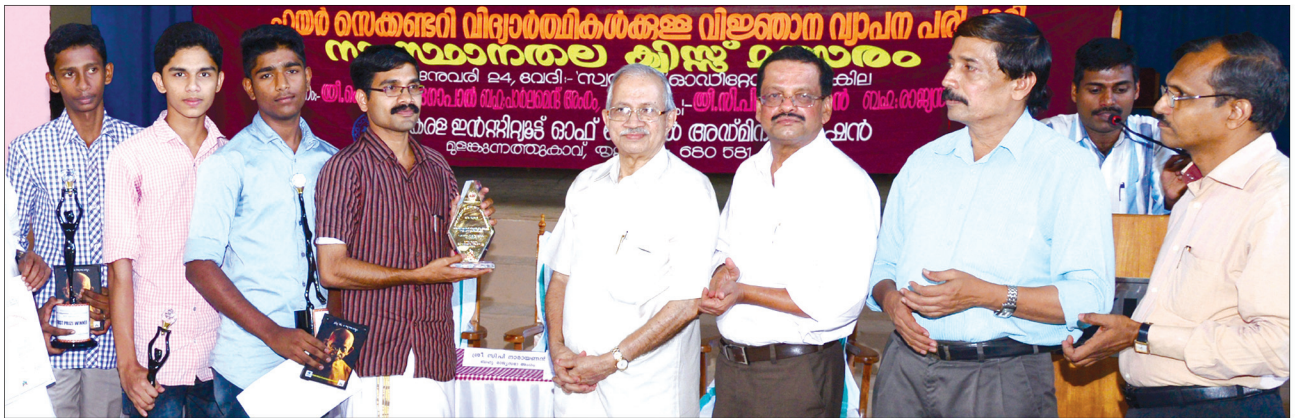
പ്രാദേശികഭരണത്തെക്കുറിച്ച് പ്ലസ്-2 വിദ്യാർത്ഥികൾക്കായി കില സംഘടിപ്പിച്ച വിജ്ഞാനവ്യാപന പരിപാടിയുടെ സംസ്ഥാനതല കിസ് മത്സരത്തിൽ ഒന്നാംസ്ഥാനം കരസ്ഥമാക്കിയ കണ്ണൂർ ജില്ലാ 71