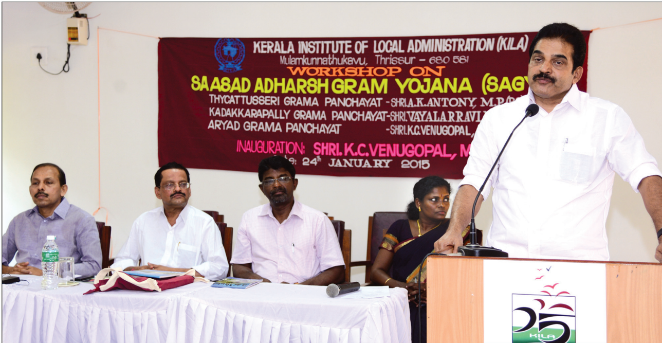
സൻസദ് ആദർശ് ഗ്രാമയോജന പദ്ധതിപ്രകാരം തെരഞ്ഞെടുത്ത തൈക്കാട്ടുശ്ശേരി, കടക്കരപ്പള്ളി, ആര്യട് ഗ്രാമപഞ്ചായത്തുകളിലെ ജനപ്രതിനിധികൾ, ഉദ്യോഗസ്ഥർ, രാഷ്ട്രീയപ്രവർത്തകർ എന്നിവരുടെ സംയുക്തയോഗം കിലയിൽ കെ.സി.വേണുഗോപാൽ എം.പി. ഉദ്ഘാടനം ചെയ്യുന്നു