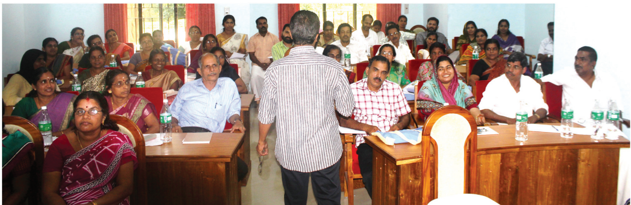
കിലയിൽ സംഘടിപ്പിച്ച നഗരസഭകളിലെ വിദ്യാഭ്യാസ സ്റ്റാൻഡിംഗ് കമ്മിറ്റി അംഗങ്ങളുടെ പരിശീലനം