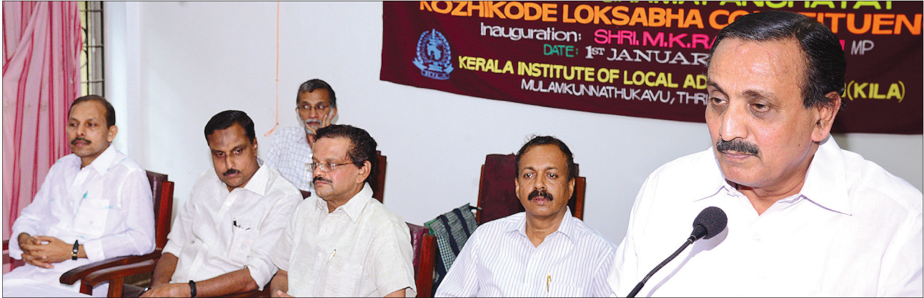
സൻസദ് ആദർശ് ഗ്രാമയോജന പദ്ധതി പ്രകാരം തെരഞ്ഞെടുത്ത ഉണ്ണിക്കുളം ഗ്രാമപഞ്ചായത്തിലെ ജനപ്രതിനിധികളുടേയും ഉദ്യോഗസ്ഥ-സാമൂഹ്യ-രഷ്ട്രീയ പ്രവർത്തകരുടേയും യോഗം കിലയിൽ എം.കെ.രാഘവൻ എം.പി.ഉദ്ഘാടനം ചെയ്യുന്നു