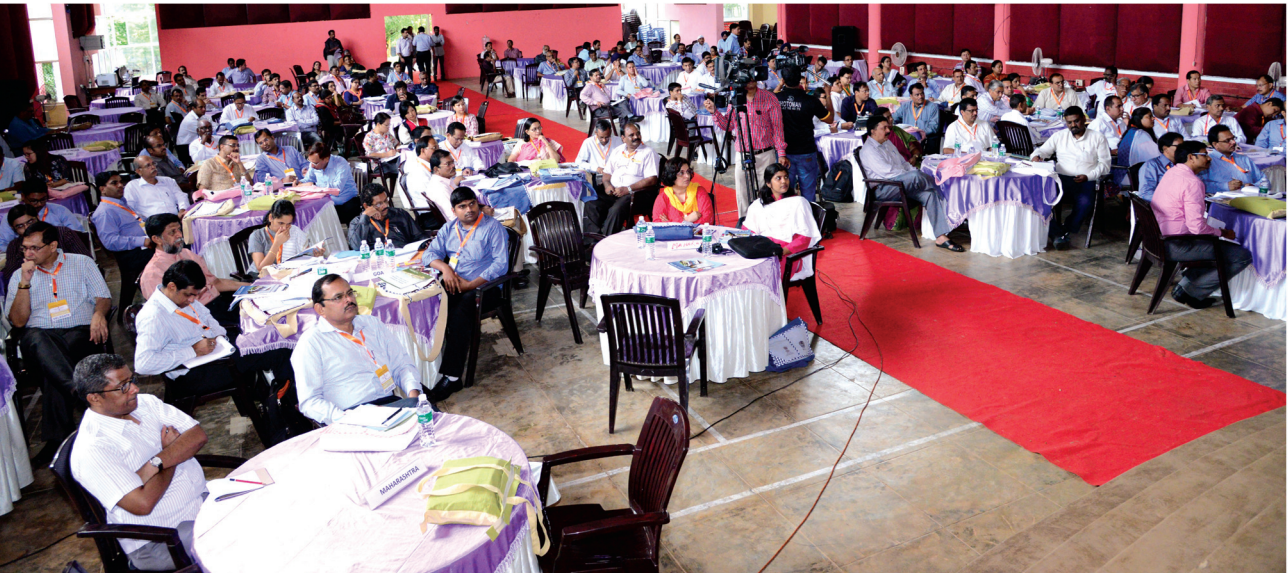
ശില്പശാലയിൽ പങ്കെടുത്ത 27 സംസ്ഥാനങ്ങളിൽനിന്നുള്ള പ്രതിനിധികൾ