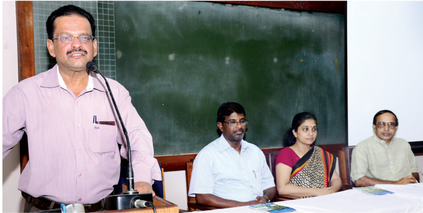
ഐ.സി.ഡി.എസ് സൂപ്പർവൈസർമാർക്കു കിലയിൽ സംഘടിപ്പിച്ച സംസ്ഥാനതല പരിശീലന പരിപാടി