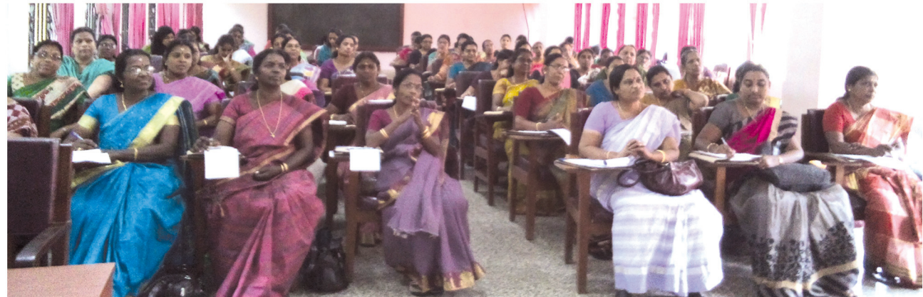
പരിശീലന പരിപാടിയിൽ പങ്കെടുത്ത ഐ.സി.ഡി.എസ് സൂപ്പർവൈസർമാർ

ഓരോ പഞ്ചായത്തിലേയും അങ്കണവാടികളുടെ മേൽനോട്ട ചുമതലയുള്ളവരാണ് ഐ.സി.ഡി.എസ് സൂപ്പർവൈസർമാർ.പഞ്ചായത്തുതല ജാഗ്രതാസമിതികളുടെ കൺവീനർമാർക്കുടയാണിവർ. സ്ത്രീകൾക്കും കുട്ടികൾക്കുമെതിരെയുള്ള അതിക്രമങ്ങളും പീഡനങ്ങളും തടയുകയാണ് ജാഗ്രതാസമിതിയുടെ ലക്ഷ്യം. വനിതാ അഭിഭാഷക, പൊലീസ് സബ് ഇൻസ്പെക്ടർ, ജനപ്രതിനിധികൾ, രാഷ്ട്രീയപാർട്ടി പ്രതിനിധികൾ, സന്നദ്ധപ്രവർത്തകർ തുടങ്ങിയവരെല്ലാം പഞ്ചായത്തുതല ജാഗ്രതാസമിതിയിലെ അംഗങ്ങളാണ്.