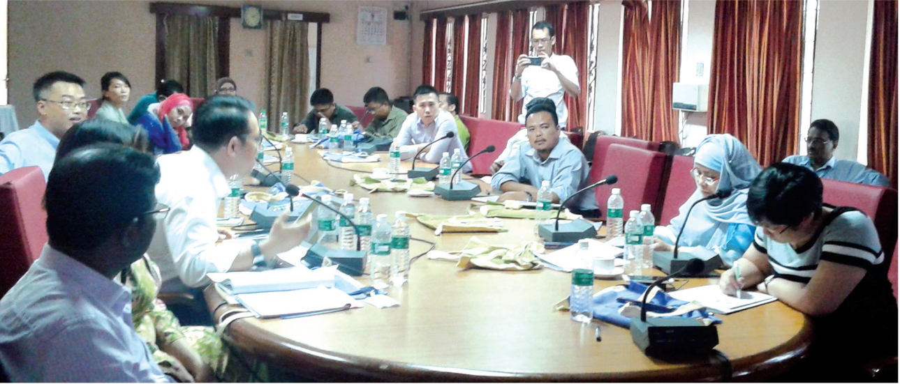
ത്രിതല പഞ്ചായത്ത് സംവിധാനത്തെക്കുറിച്ച് പരിക്കാൻ കിലയിലെത്തിയ മലേഷ്യൻ പ്രതിനിധിസംഘം