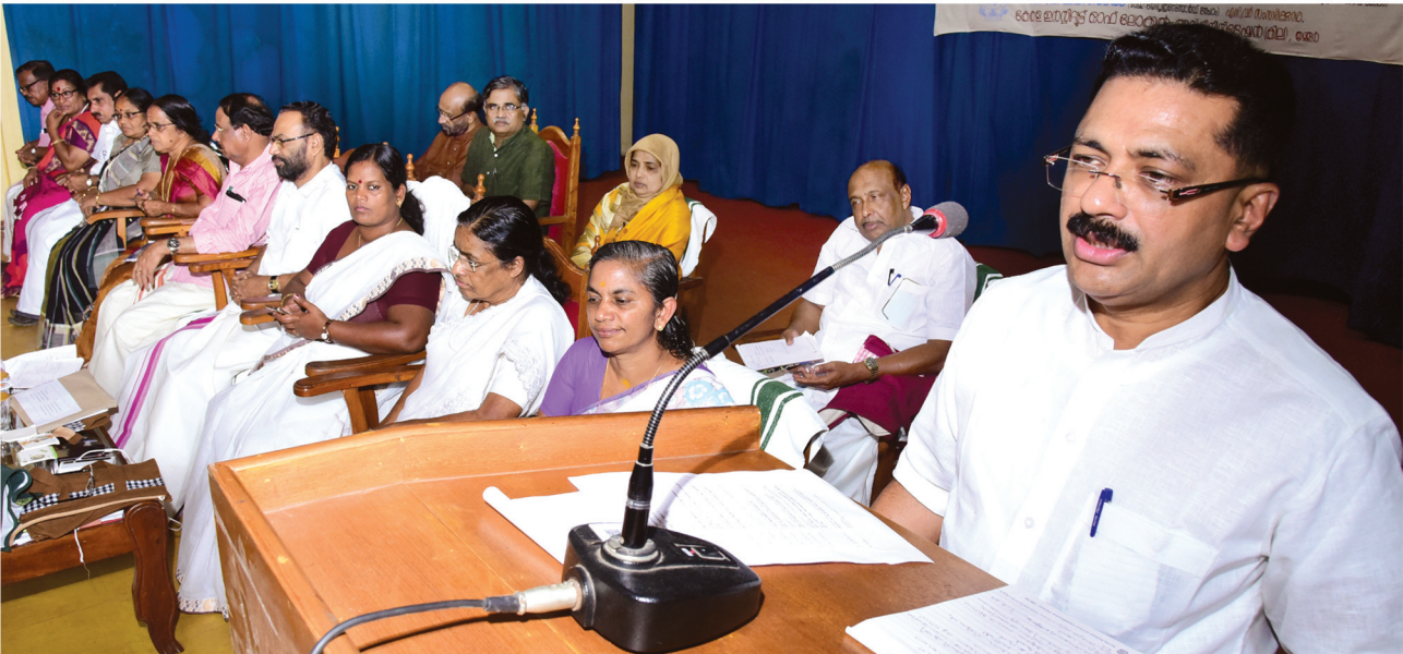
പദ്ധതി നിർവഹണവും നവകേരളമിഷനും ആയി ബന്ധപ്പെട്ട് ജില്ലാപഞ്ചായത്ത് അംഗങ്ങൾക്കു കിലയിൽ സംഘടിപ്പിച്ച ഏകദിന ശില്പശാല തദ്ദേശസ്വയംഭരണവകുപ്പുമന്ത്രി ഡോ.കെ.ടി. ജലീൽ ഉദ്ഘാടനം ചെയ്യുന്നു