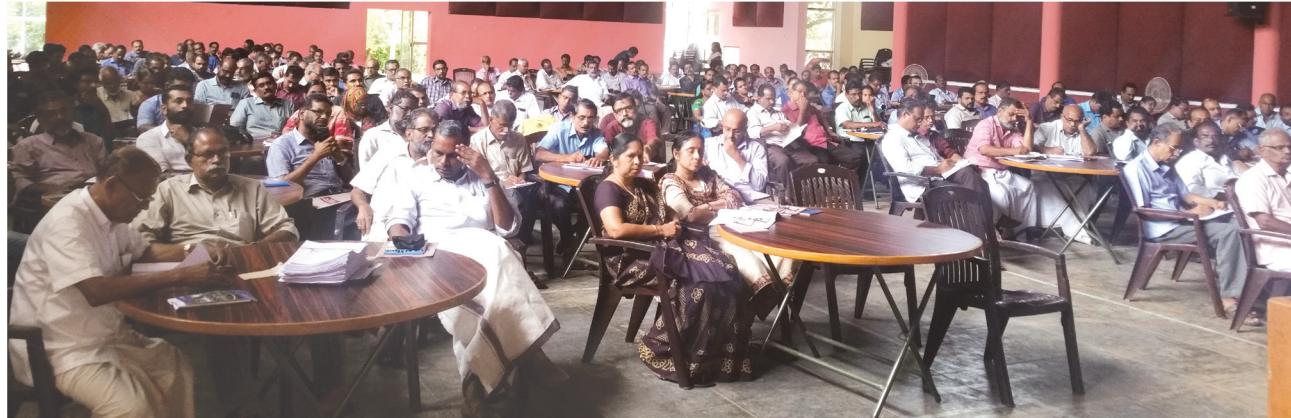
ജനകീയാസൂത്രണത്തിന്റെ കാര്യശേഷി വികസന പരിപാടിയുടെ അഞ്ചാംഘട്ടമായ പദ്ധതി നിർവഹണവും മോണിറ്ററിംഗുമായി ബന്ധപ്പെട്ട് കിലയിൽ ആരംഭിച്ച പരിശീലകപരിശീലനത്തിൽ പങ്കെടുത്തവർ