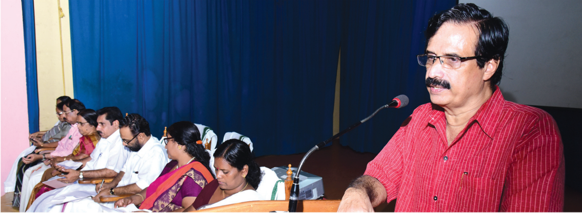
കിലയിൽ സംഘടിപ്പിച്ച ജില്ലാപഞ്ചായത്ത് അംഗങ്ങൾക്കുള്ള സംസ്ഥാനതല ശില്പശാലയിൽ നവകേരളമിഷനും പൊതുവിദ്യാഭ്യാസ സംരക്ഷണയജ്ഞവും എന്ന വിഷയത്തെക്കുറിച്ച് വിദ്യാഭ്യാസവകുപ്പുമന്ത്രി പ്രൊ.ഫ. സി.രവീന്ദ്രനാഥ് സംസാരിക്കുന്നു