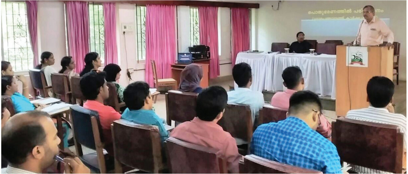
പൊതുഭരണത്തെക്കുറിച്ച് ഗ്രാമപഞ്ചായത്ത് ക്ലാർക്കുമാർക്കു കിലയിൽ സംഘടിപ്പിച്ച പരിശീലന പരിപാടി