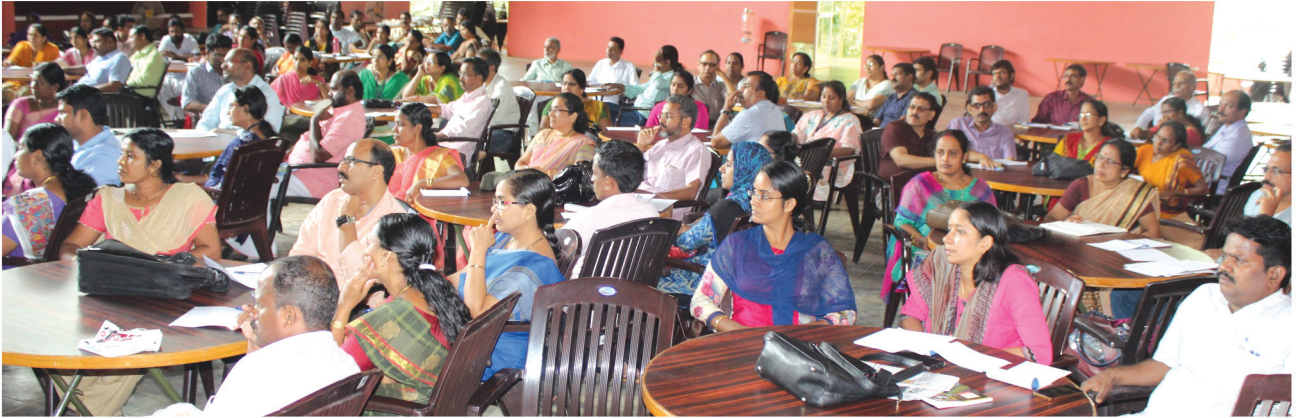
ജനകീയാസൂത്രണത്തിന്റെ കാര്യശേഷിവികസന പരിപാടിയായ പദ്ധതിനിർവഹണവും മോണിറ്ററിംഗുമായി ബന്ധപ്പെട്ട് കിലയിൽ സംഘടിപ്പിച്ച ബ്ലോക്ക്തല ശില്പശാല